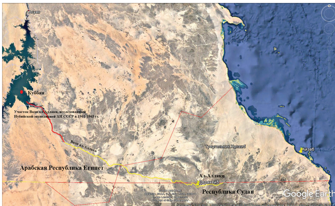
Рисунок 1. Карта, сделанная на основе сервиса Google Планета Земля с указанием основных географических названий, упомянутых в статье

Figure 1. Geographical features mentioned in the article (Map made on the base of the Google Earth image)