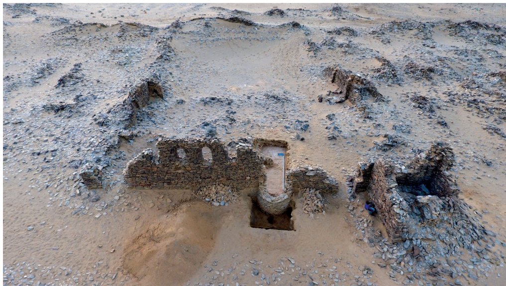
Рисунок 4. Объект № 3, «Мечеть». Вид с востока Figure 4. Object 3, "The Mosque". View from the East