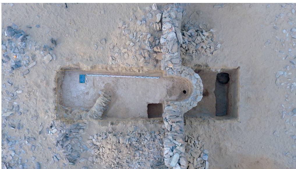
Рисунок 5. Стратиграфическая траншея на Объекте № 3 Figure 5. Object 3. Stratigraphic Trench

примыкающую к стене, в середине которой располагался полукруглый выступ, ниша – михраб , являющийся важнейшей частью любой мечети, указывающий направление на Мекку.