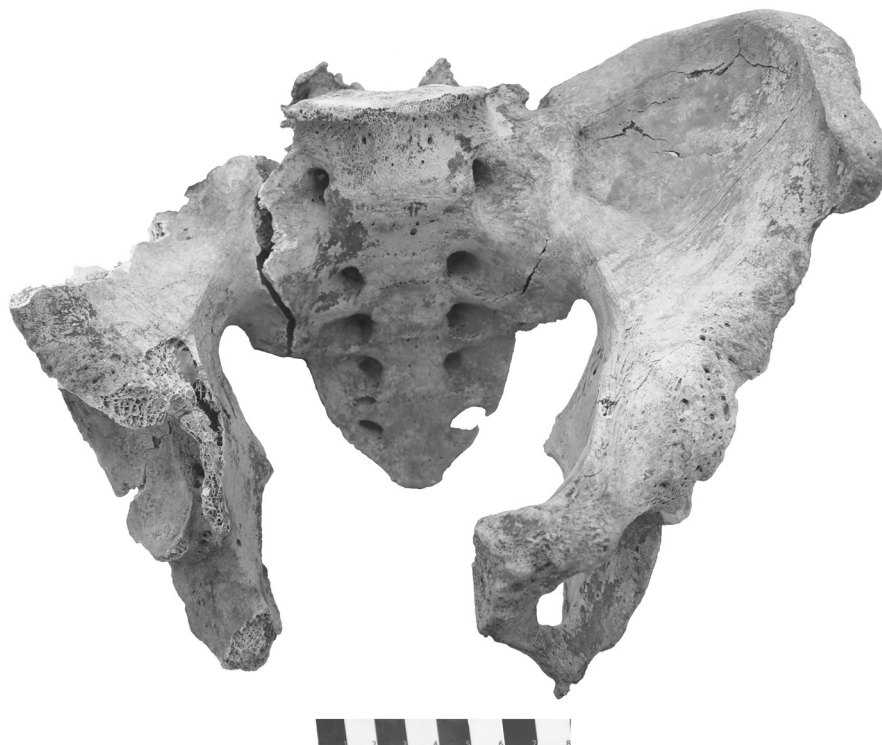
Рисунок 11. Анкилоз обоих крестцово-подвздошных сочленений. Мужчина, погребение № 5 Figure 11. Ankylosis of both sacroiliac joints. Male, burial 5

Krol A.A. 1) , Berezina N.Y. 1) , Zaitsev Yu.P. 2) , Reshetnikova N.A. 1)