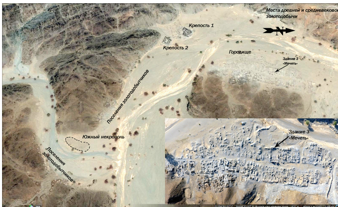
Рисунок 2. Карта Дерахейба с указанием основных археологических объектов памятника. Сделана на основе сервиса Google Планета Земля

Figure 1. Geographical features mentioned in the article (Map made on the base of the Google Earth image)