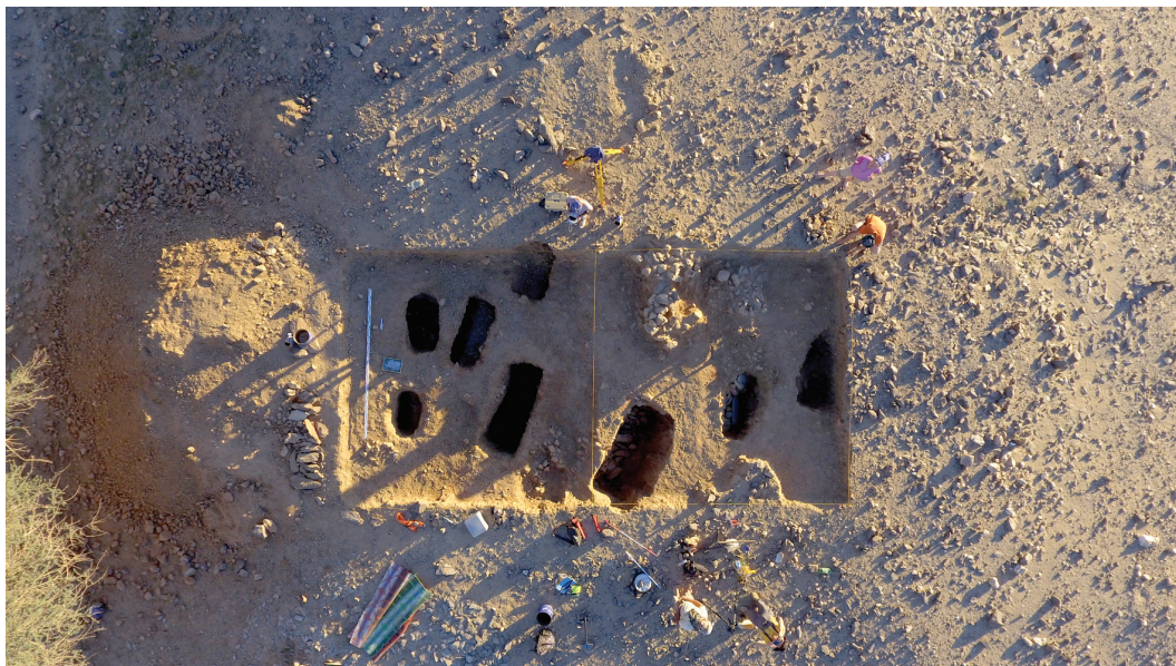
Рисунок 9. Общий вид исследованного участка Южного Некрополя Figure 9. Overview of the excavated part of the South Necropolis