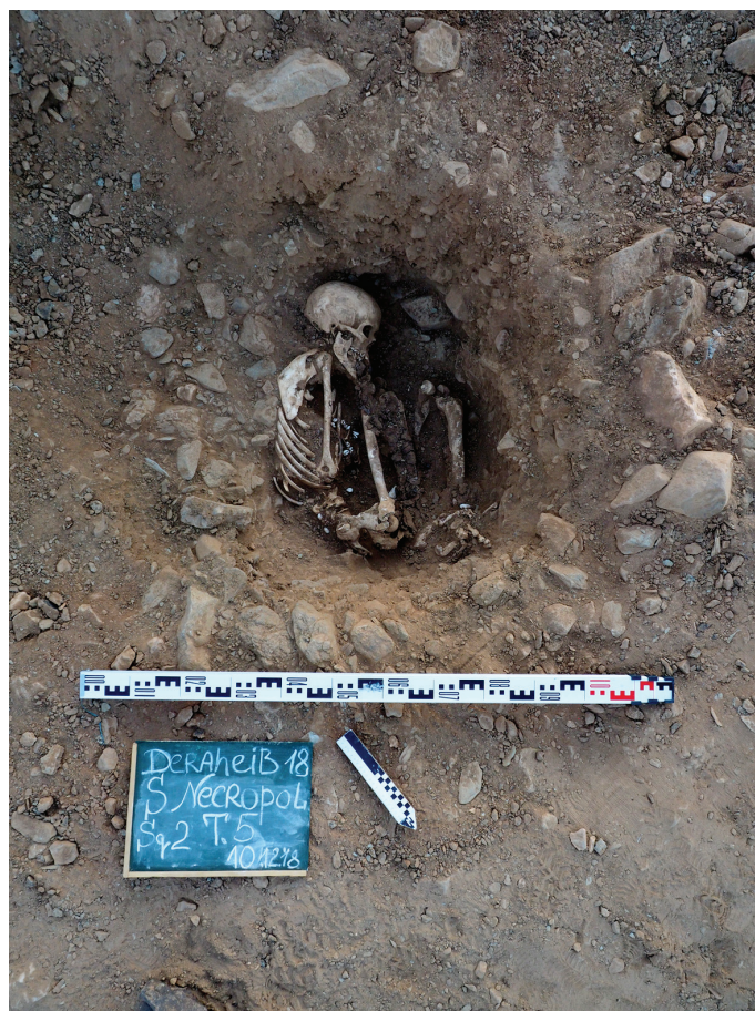
Рисунок 10. Могила № 5 Figure 10. Tomb 5