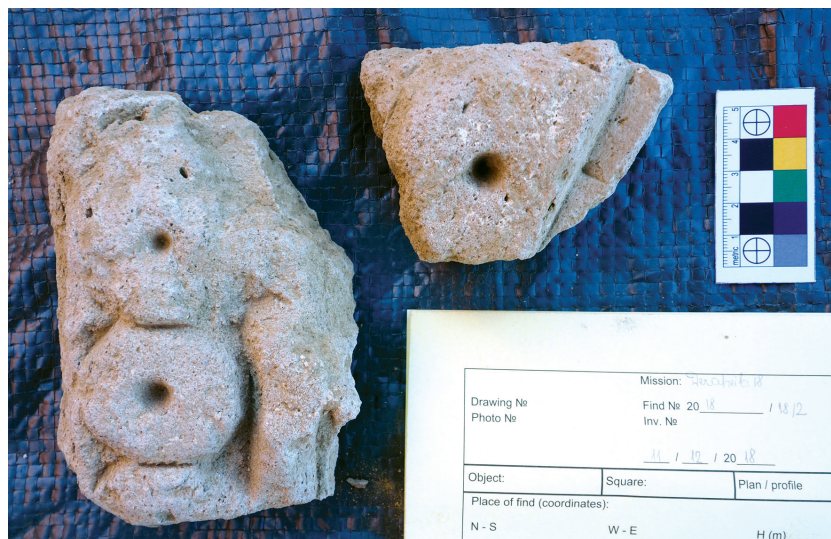
Рисунок 6. Фрагменты найденных декоративных элементов Figure 6. Fragments of a decorative band