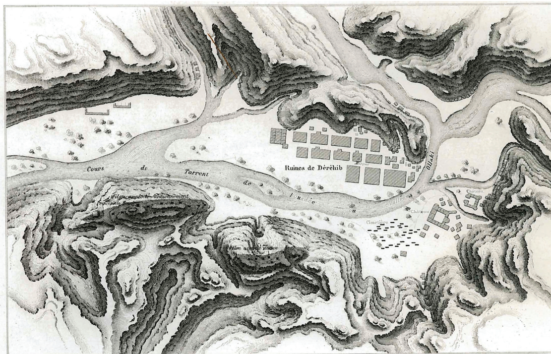
Рисунок 3. Схематическая карта памятника Дерахейб, составленная Л. Ленаном де Бельфоном [Linant de Bellefonds, 1986, III. 2]