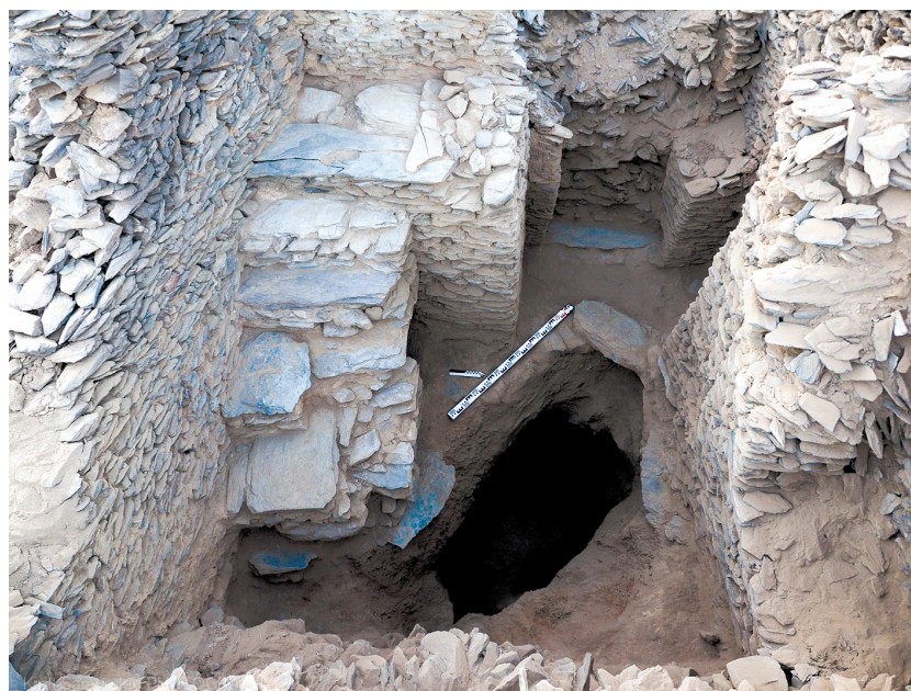
Рисунок 7. Здание 1. Помещение 1 Figure 7. Building 1. Room 1

дования Здания было принято решение углубить раскоп для чего были вскрыты плиты сланца, лежащие на дне раскопа. Под ними была обнаружена засыпанная шахта, вырубленная в гранитной породе. Заполнение представлено супесью, фрагментами рушенной горной породы, обломками сланца. Заполнение содержало большое число керамических черепков (по преимуществу средневековая глазурованная ближневосточная импортная керамика) 2 . Нижние слои содержали значительное